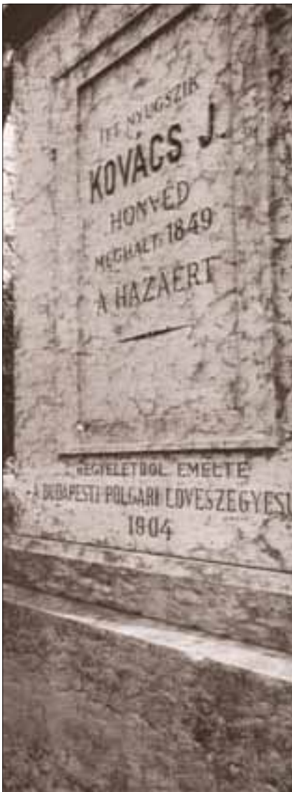
A Pethényi úti emlékmű

A koszorúzásokat követően a Téglá utcában tartott ünnepi