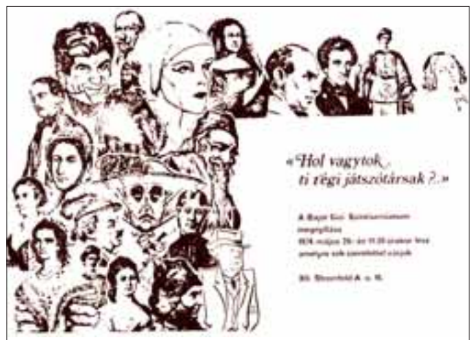
Több mint harminc éve nyílt meg a színházmúzeum